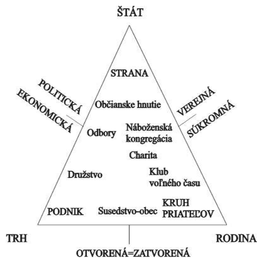
Model č. 2:

Významnú úlohu pri raste veľkosti tohto priestoru zohráva vzdialenosť medzi jednotlivými sociálnymi inštitúciami alebo periméter, ktorým sa vyjadruje vyváženosť pôsobnosti všetkých inštitúcií.